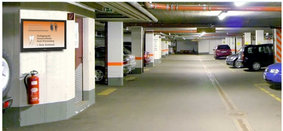
Vandalismussicheres Info-Display in der Tiefgarage begrüßt die Teilnehmer eines Dental-Kongresses.